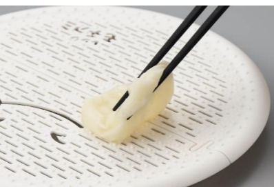
曙産業 レンジモチアミ

そんな時は、 電子レンジの活用 がおすすめです。「でも、べたべたになって、お皿にくっついて、はがすのが大変なんてことも。そこで、電子レンジでつきたてのおモチがつくれちゃう「 レンジモチアミ 」をおすすめします! この「レンジモチアミ」はパンの温めや、冷凍肉まんや野菜の解凍などにも使えるので重宝しますよ〜