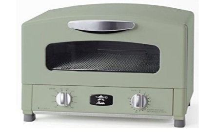
とにかく立ち上がりが早い! アラジックス グリル&トースター