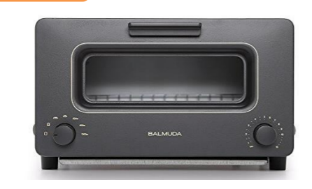
究極のトースターが食べられます! バルミューダ ザ・トースター