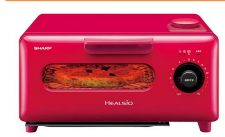
冷めたお総菜がよみがえる! シャープ ヘルシオ グリエ